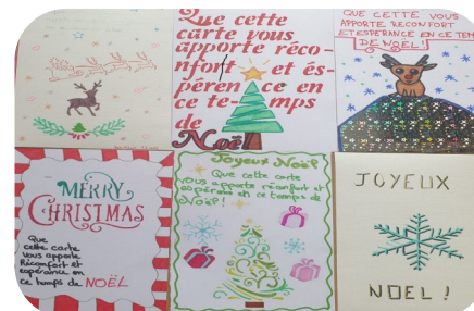
Cartes de vœux pour les prisonniers

Comme chaque année, le groupe scolaire a ouvert ses portes le 17 novembre dernier aux futurs élèves et leurs parents. Avec beaucoup de sérieux, nos élèves de 3 e ont guidé les visiteurs venus nombreux découvrir le collège et la grande diversité de nos projets. Grande joie aussi, ce soir-là, de revoir d'anciens élèves toujours heureux de revenir saluer leurs professeurs.