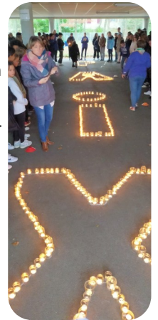
Célébration Lumière de la PAIX

personne en particulier ou à une intention en faveur de la Paix. Le mot PAIX, écrit en lettres de lumières, a ainsi illuminé la cour. Le lendemain, cette lumière de la Paix a été transmise à l'école Ste Thérèse lors d'un temps de célébration avec les enfants de maternelle et de primaire.