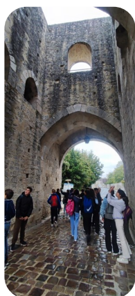
Visite de Provins par les 5e

Les 4 e Mogador, quant à eux, se sont élancés sur la terre et dans les arbres avec des parcours VTT et accrobranches dans la cadre de leur séjour d'intégration afin de bien faire équipe au sein de la classe. Et pour bien fédérer le groupe, rien de mieux qu'une nuit sous tente en pleine nature.