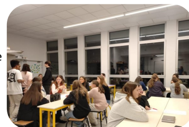
Soirée de l'orientation