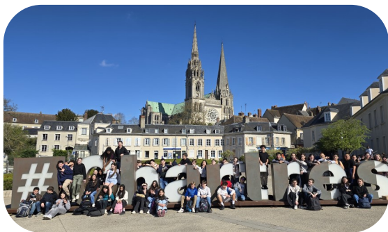
5e à Chartres

Abolir les frontières du temps, marcher sur les pas des bâtisseurs de cathédrales, découvrir la technique du vitrail, voilà ce qu'ont pu vivre, les 5 e lors d'une visite à Chartres dans le cadre de leur projet Moyen-âge et de la pastorale. Et pour parfaire leurs connaissances des colorants médiévaux, dans le cadre du cours de physique et de la pastorale,