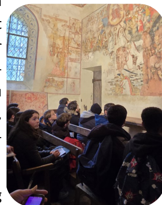
5e3 à St Forget

les 5 e3 se sont rendus à l'église de St Forget. Là-bas, ils ont découvert la magnifique fresque et réalisé leurs propres colorants avec des produits naturels.