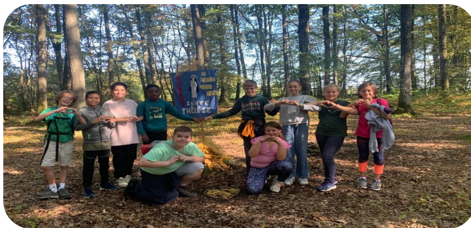
Un groupe de 6e lors de la marche pastorale du 14 septembre