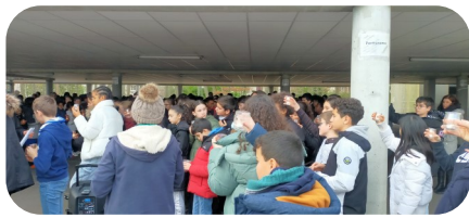
Célébration Lumière de la PAIX

Plusieurs temps festifs et fraternels en cette fin de période ont permis de resserrer les liens entre les élèves les membres de la communauté éducative.