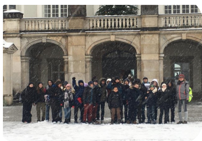
Les 4e germanistes en Allemagne

Ouvrir son cœur à l'autre, c'est être capable de s'adapter à une autre culture, à d'autres modes de vie... Fin novembre, les 4 e germanistes sont partis en Allemagne, à proximité de Munich. Ils ont fait connaissance avec leurs correspondants allemands dans le cadre de notre partenariat. Découvertes culturelles, visite de la ville de Munich et de ses marchés de Noël ont ainsi alterné avec des temps en établissement scolaires. La neige présente au rendez-vous a aussi permis à certains de découvrir la joie des sports d'hiver avec leur correspondant et la beauté des marchés de Noël n'en a été que sublimée.