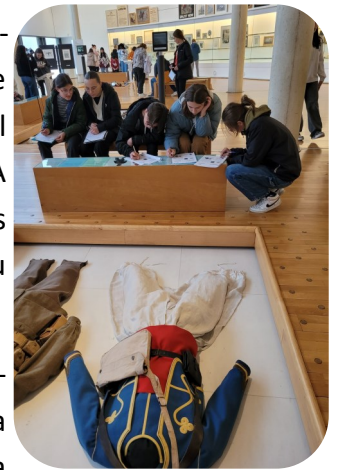
Visite de l'Historial de la Grande Guerre à Péronne.

Dans le même temps, les 3 e restés au collège, ont participé à une rencontre inter- générationnelle dans le cadre de la Semaine Bleue, en partenariat avec la mairie du Mesnil. Dans le cadre de l'EPI « Devoir de mémoire », ils ont visité l'Historial de la Grande Guerre à Péronne et fait le circuit du souvenir dans la Somme. A travers la découverte de ces lieux de mémoire, les élèves ont pu faire des liens avec leur cours d'histoire et de se préparer à participer aux commémorations du 11 novembre.