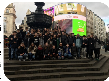
4e en Angleterre

Au cours du mois de mars, les quatrièmes ont eu la chance de franchir quelques frontières terrestres. La classe de 4 e Winter Camp s'est ainsi envolée pour deux semaines au Canada. Au programme, cours en anglais, pratique sportive, découverte d'une nouvelle culture et apprentissage de la vie en communauté. Pendant ce temps, leurs camarades hispanisants partaient à la découverte de l'Angleterre. Cette ouverture culturelle et linguistique sur le monde s'est ensuite poursuivie avec l'accueil des correspondants allemands. L'an prochain, nous fêterons les 25 ans de l'échange avec nos partenaires allemands du Haar Gymnasium : l'occasion de célébrer notre amitié, tissée avec le temps par-delà les frontières.