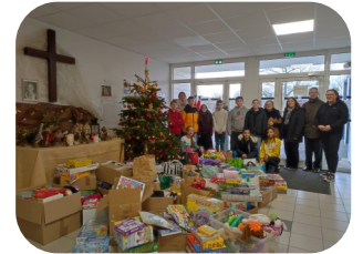
Collecte de jouets pour l'A.M.E

La collecte de jouets pour l'A.M.E a été également couronnée d'un grand succès : le traîneau du père Noël a été bien rempli grâce à votre générosité. Un grand merci à chacun et en particulier aux parents bénévoles venus aider à encadrer les ateliers.