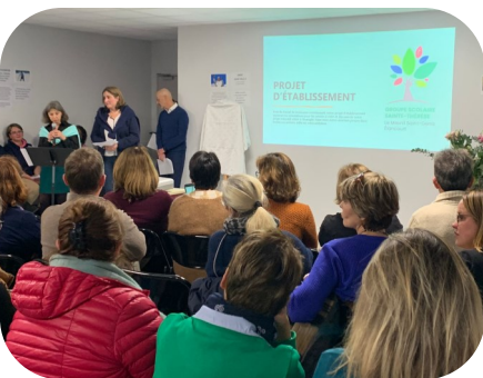
Promulgation projet établissement

Le 7 novembre à 17h30, pour se remettre en route en beauté, le groupe scolaire a pris un nouvel élan pour les années à venir. Ce soir-là, a été promulgué le nouveau projet d'établissement, fruit du travail menée par toute la communauté au cours de l'année dernière.