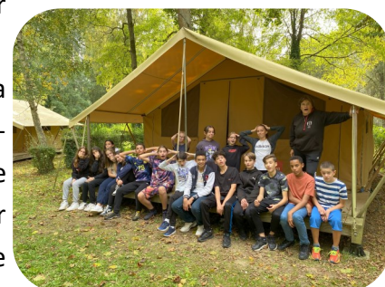
4e Mogador au séjour d'intégration