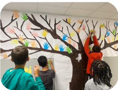
L'arbre de la Paix