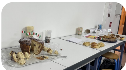
Petits déjeuner du monde

Un petit déjeuner « du monde » organisé par les 6 e 1 et les 6 e 2 dans le cadre du cours de SVT a permis d'ouvrir les cœurs et les papilles en découvrant des spécialités venues des cinq continents. Chaque élève était fier de pouvoir partager des spécialités de son pays ou issues de traditions familiales. Un beau temps d'échange fraternel à quelques jours de Noël.