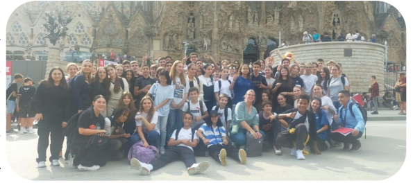
Les 3e devant la Sagrada Familia

Saut dans l'inconnu pour nos élèves de 3 e hispano- phones partis en séjour découverte et linguistique à Barcel- lone. Ils se sont ainsi familiarisés avec l'univers architectural de Gaudi et ont acquis des connaissances utiles pour leur pro- jet interdisciplinaire ayant pour thème l'urbanisation de Bar- celone de l'antiquité à nos jours.