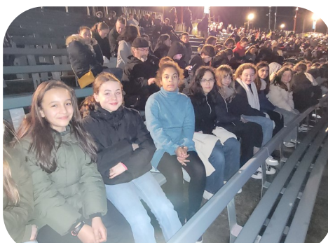
6e3 et 6e4 au Futuroscope

Partir à la découverte de l'espace et du système solaire tel est le programme proposé aux 6 e sur cette période. Les 6 e Fratellini et 6 e Odysée ont embarqué pour le Futuroscope dans le cadre d'un projet pédagogique nommé « Objectif mars » pendant que les 6 e Dickens ont eu la chance de visiter l'observatoire de Meudon et d'observer le Soleil.