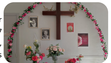
Fête de la Sainte Thérèse