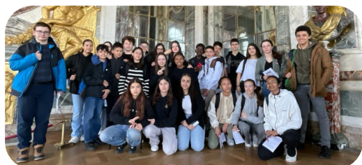
4e3 à Versailles

Remontant le temps, les 4 e Silver Spring sont allés visiter le château et les jardins de Versailles dans le cadre de l'EPI « Arts et Sciences à Versailles au XVII ».