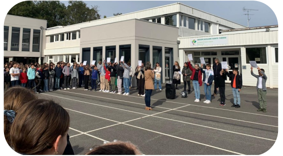
Temps de recueillement du 23 octobre.

« Là où est la haine que je mette l'amour », c'est par la prière de St François d'Assise que nous avons débuté notre temps de recueillement, façon de réaffirmer notre volonté de ne pas nous laisser voler notre espérance et de sans cesse veiller à cultiver des liens fraternels malgré nos différences.