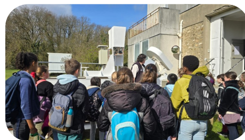
6e1 Sortie à l'observatoire de Meudon

Partir à la découverte de l'espace et du système solaire tel est le programme proposé aux 6 e sur cette période. Les 6 e Fratellini et 6 e Odysée ont embarqué pour le Futuroscope dans le cadre d'un projet pédagogique nommé « Objectif mars » pendant que les 6 e Dickens ont eu la chance de visiter l'observatoire de Meudon et d'observer le Soleil.