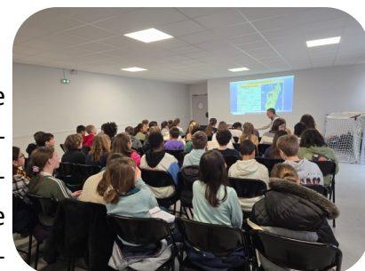
Intervention Les crayons de l'Espoir

Pour apprendre aux jeunes à dépasser les frontières de l'indifférence et s'ouvrir à l'autre, plusieurs actions et interventions leur ont été proposées. Ainsi l'association « Les crayons de l'espoir » qui aide à la scolarisation d'enfants à Madagascar, que nous soutenions à l'occasion du bol de riz, est intervenue auprès des 6 e pour leur présenter son action et les sensibiliser à la situation des enfants malgaches.